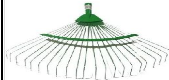
Kit 3 Ancinhos Rastelos Profissionais Grande 22 Dentes