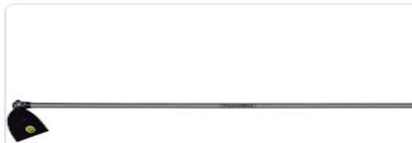
Enxada Larga 2.5 Com Cabo Metálico 140 Cm Tramontina 77214954 5.0 ★★★★★ 6