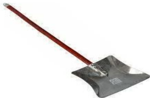
Pá De Lixo Galvanizada Viel Cabo Longo

BÁSICO E TERMO DE REFERENCIA E PLANILHAS EM SEUS ANEXOS.