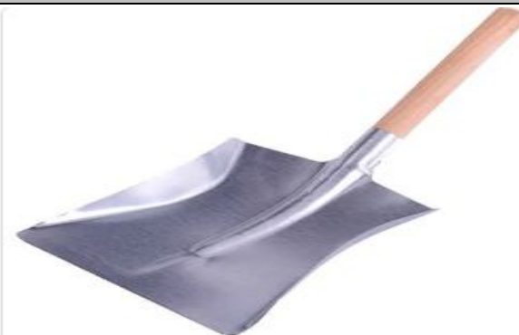
Pá De Lixo Cabo De Madeira Galvanizada Viel