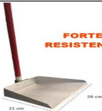
Pá De Lixo galvanizada Cabo De 80 Cm (RESISTENTE)