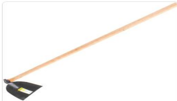
Enxada Larga Com Cabo - Vonder

BÁSICO E TERMO DE REFERENCIA E PLANILHAS EM SEUS ANEXOS.