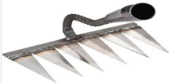
Ferramenta Rastelo Ancinho Capina 6 Pontas

OBJETO: CONTRATAÇÃO DE EMPRESA ESPECIALIZADA PARA PRESTAÇÃO DE SERVIÇOS DE LIMPEZA URBANA EM LOGRADOUROS E AREAS NO MUNICÍPIO DE JOÃO MONLEVADE/MG, CONFORME PROJETO BÁSICO E TERMO DE REFERENCIA E PLANILHAS EM SEUS ANEXOS.