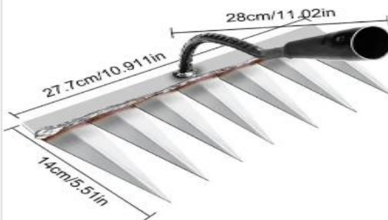
Ferramenta Agrícola Multifuncional, Ferramenta Agrícola Multifuncional - 7