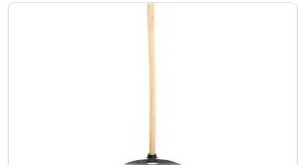
Enxada Larga 2,5Lb Com Cabo Vonder