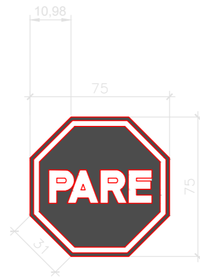
REGULAMENTAÇÃO PARADA OBRIGATÓRIA