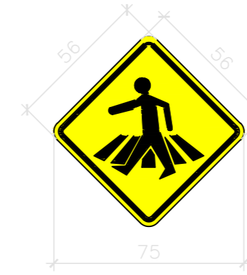
ADVERTÊNCIA PASSAGEM SINALIZADA DE PEDESTRES