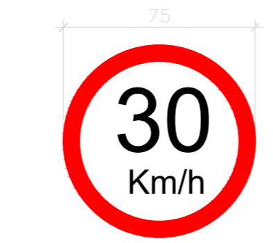
REGULAMENTAÇÃO VELOCIDADE MÁXIMA