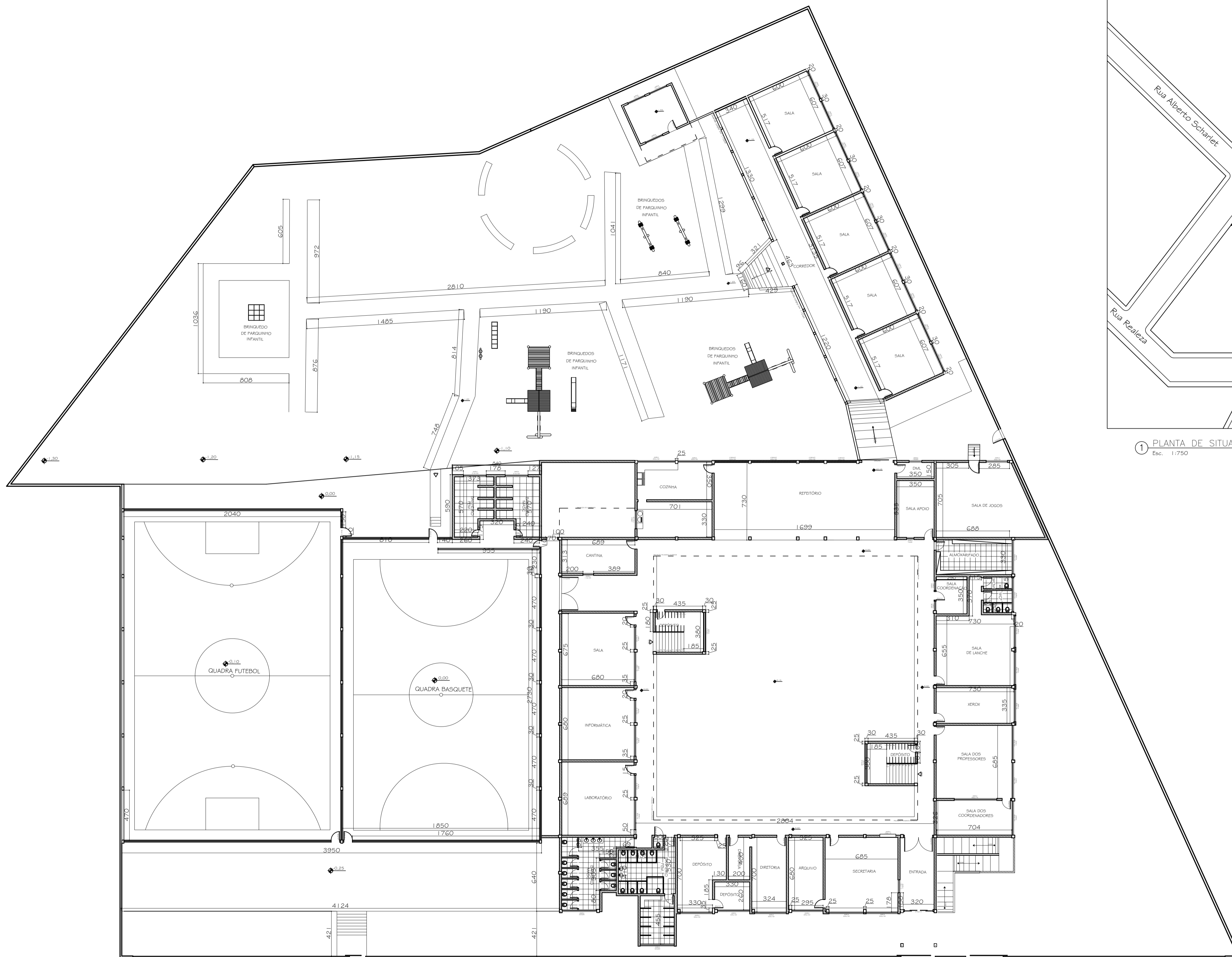
② PLANTA BAIXA ATUAL PAVIMENTO TÉRREO - GERAL Esc. 1:200