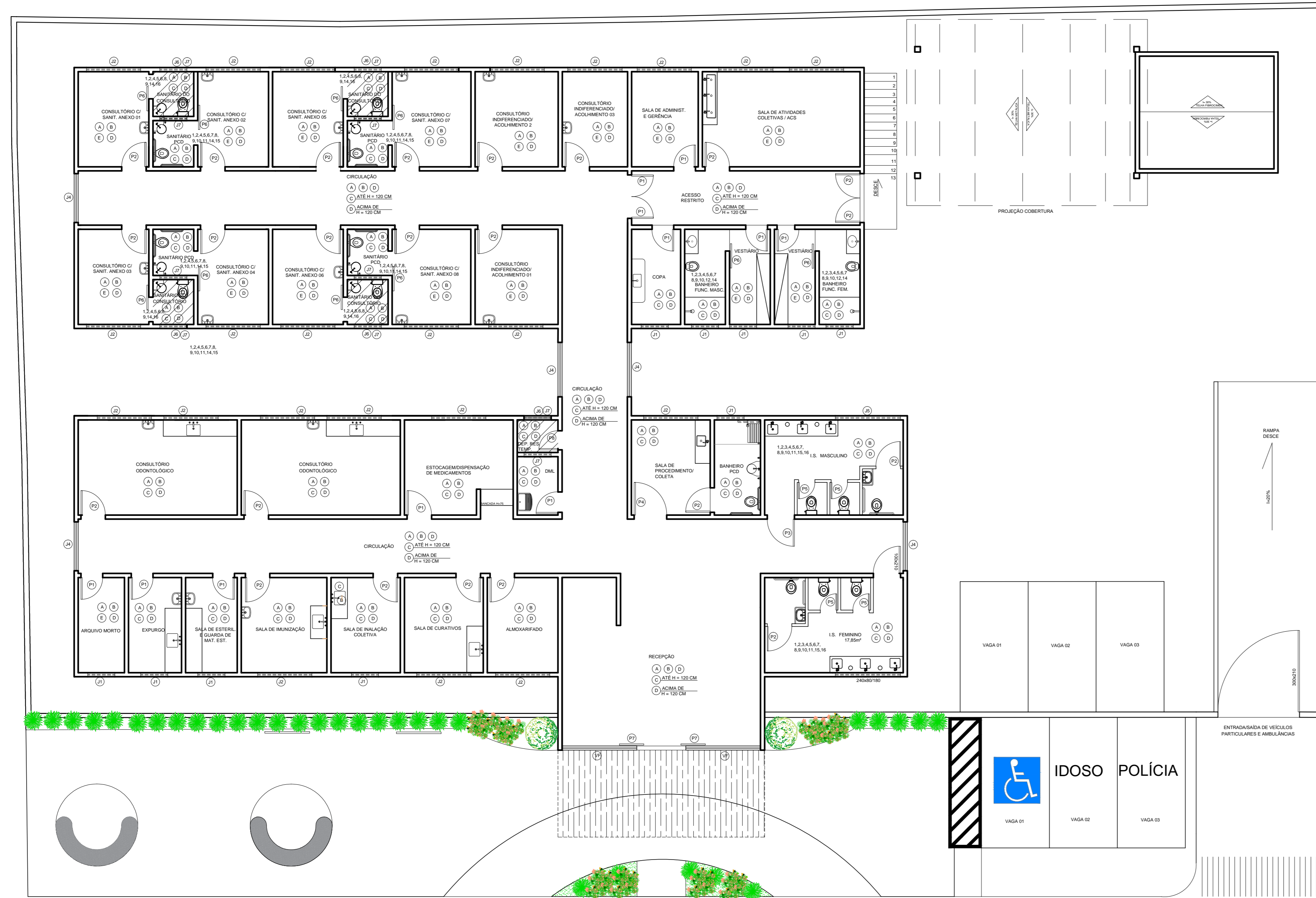
PLANTA DE DETALHAMENTO