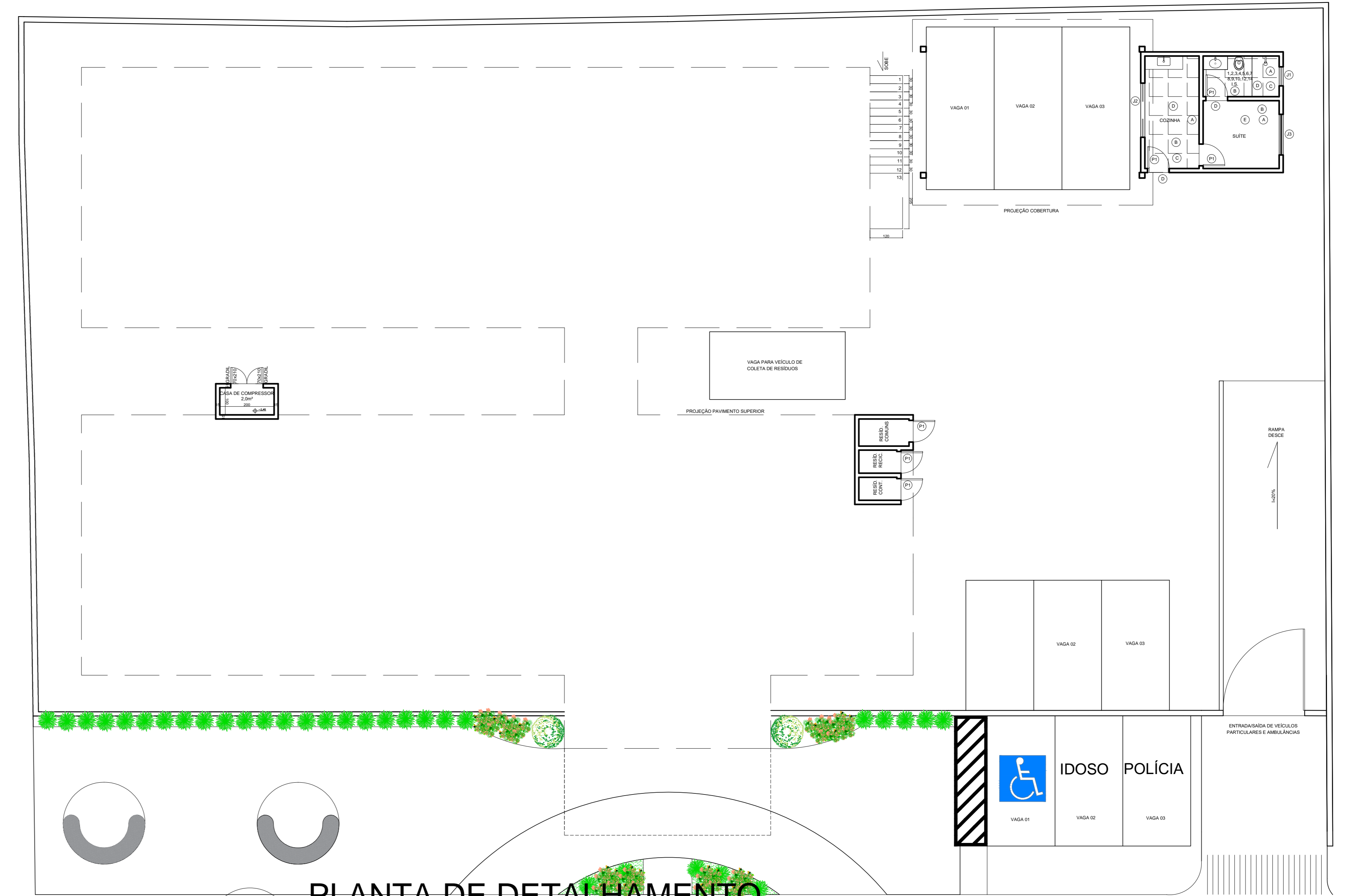
PLANTA DE DETALHAMENTO