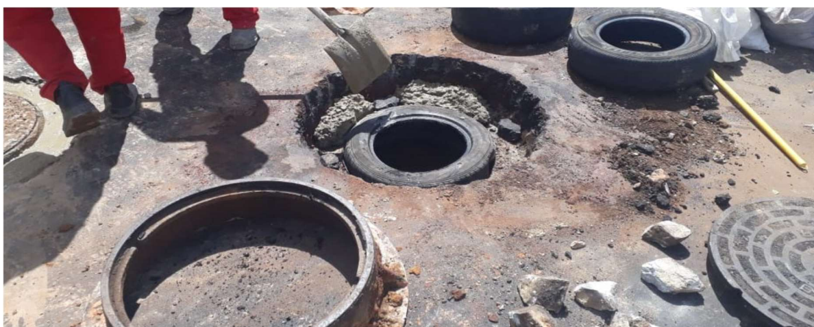
Concretagem da base utilizando pneu como fôrma.